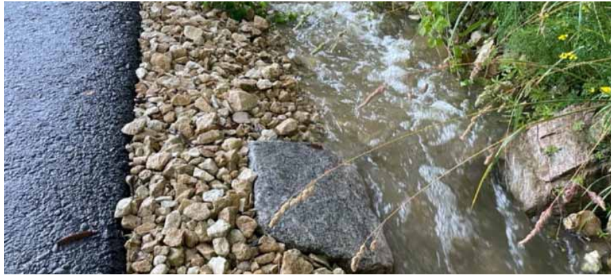
Ablaufgraben oberhalb Einlaufschacht Leimengasse.