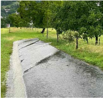
Wasser wird durch Belagsmulde abgeführt und auch mit Rinnen seitlich ausgeleitet.