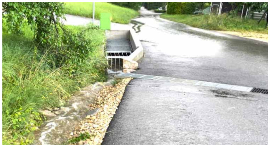
Einlaufschacht Leimengasse, Blick Richtung Dorf

Am Abend des 25. Juni 2024 ist ein heftiges Gewitter über die Region gezogen. Die zwischen 18.45 und 20.45 gefallenen Regenmengen waren beträchtlich. Sie haben dazu geführt, dass der Rueschtelbach und im Oristal die seitlich zufließenden Bäche (Binntal, Oris-