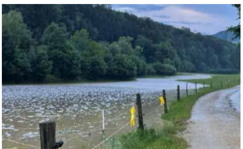
Strasse nach Lupsingen. Das Bachbett des Rueschtelbachs konnte die Wassermengen nicht mehr fassen.